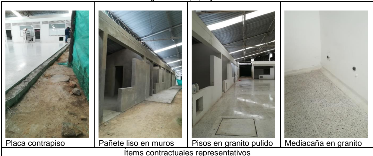
Imágenes N° 3, 4, 5 y 6