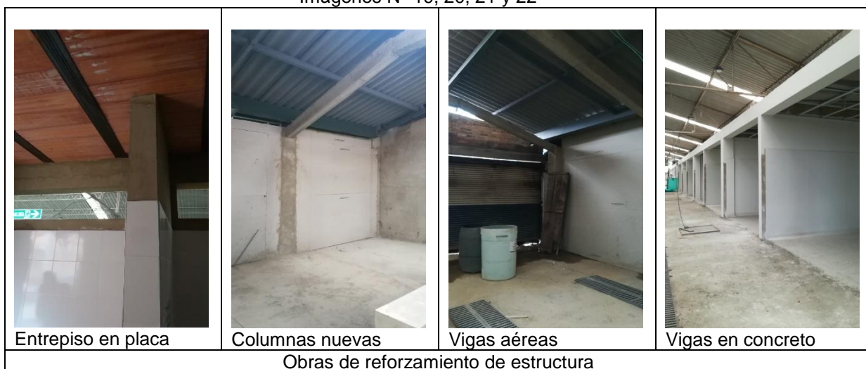
Imágenes N° 19, 20, 21 y 22

Fuente: Visita técnica equipo auditor. 24 de mayo de 2021