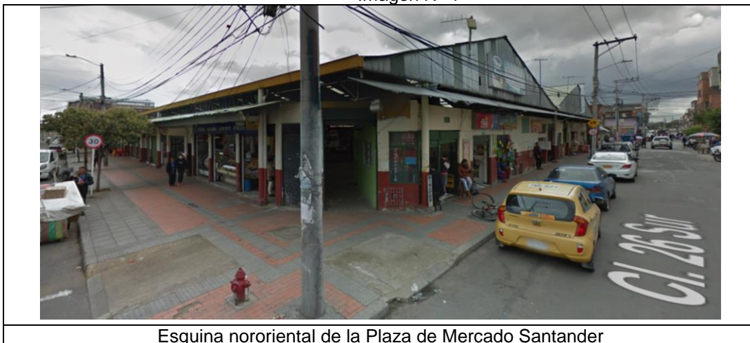
Esquina nororiental de la Plaza de Mercado Santander