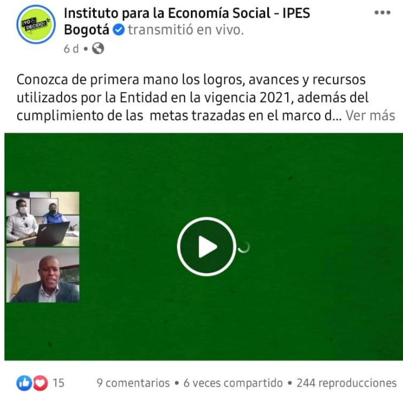
Imagen 2. Transmisión en vivo Segundo espacio de rendición de cuentas y encuentro ciudadano.