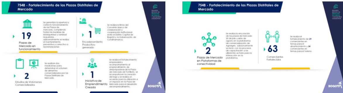
Imagen 8. Transmisión en vivo Segundo espacio de rendición de cuentas y encuentro ciudadano.