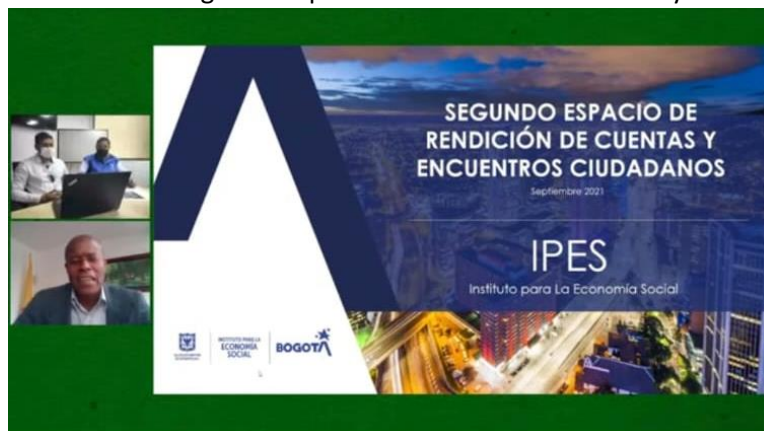
Imagen 1. Transmisión en vivo Segundo espacio de rendición de cuentas y encuentro ciudadano.

Segundos Espacios de Rendición de Cuentas 2021 / IPES