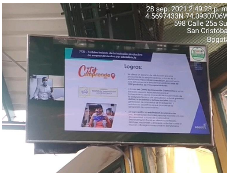
Imagen 6. Transmisión en vivo Segundo espacio de rendición de cuentas y encuentro ciudadano.