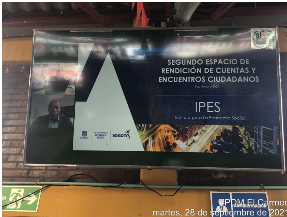
Imagen 9. Transmisión en vivo Segundo espacio de rendición de cuentas y encuentro ciudadano.