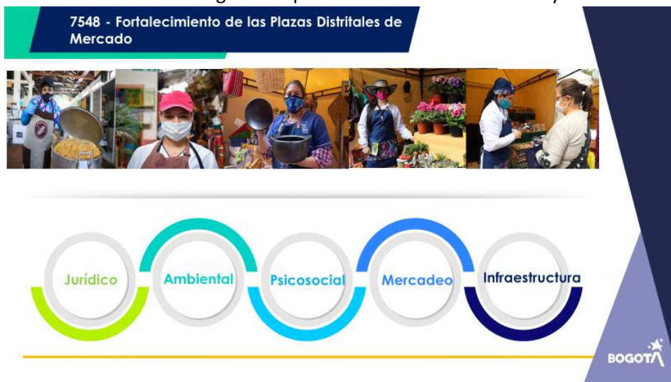
Imagen 7. Transmisión en vivo Segundo espacio de rendición de cuentas y encuentro ciudadano.