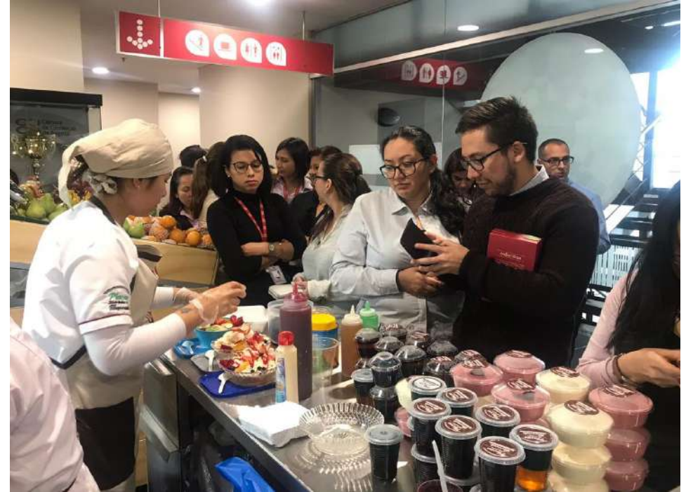
► De la Plaza a su Trabajo – Cámara de Comercio de Bogotá

495 ► Actividades de promoción y mercadeo.