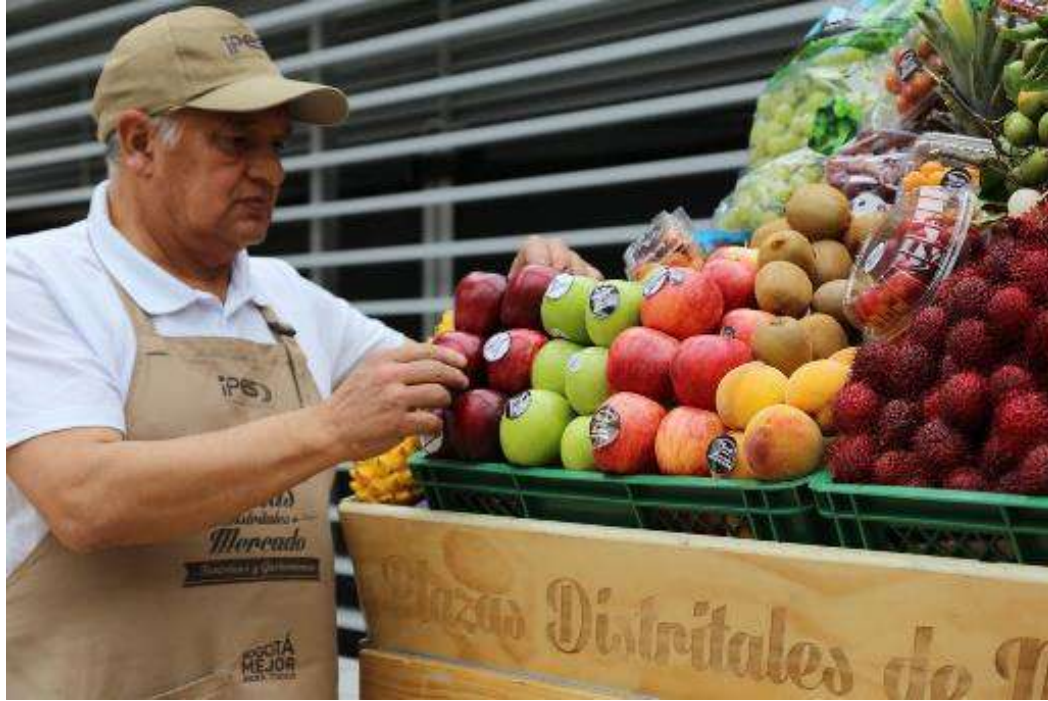
► Evento de Ciudad - Cumbre revista Semana